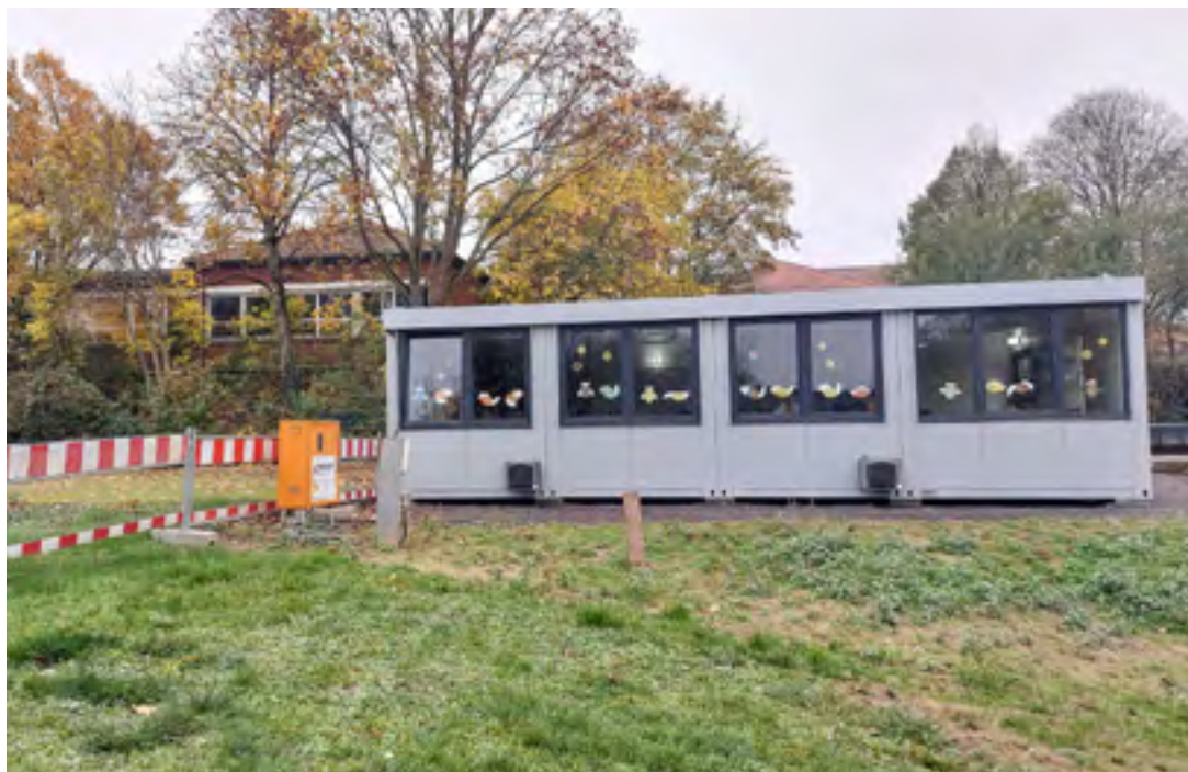
Der mobile Klassenraum an der Grundschule Monsheim wird von Schülern und Lehrkräften überwiegend positiv bewertet – auch, wenn das Umfeld noch etwas aufgewertet werden muss.

Im Rahmen der Schulbegehung wurden darüber hinaus Beschaffungs- und Sanierungsmaßnahmen für das kommende Haushaltsjahr